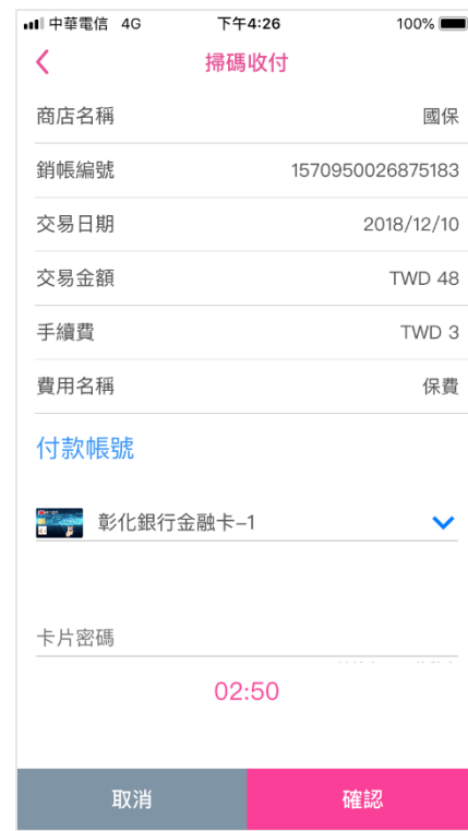
自動帶入繳費資訊，選擇卡片、輸入密碼