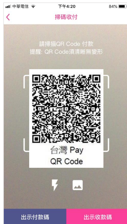
掃描繳費帳單上「台灣 Pay」QR Code