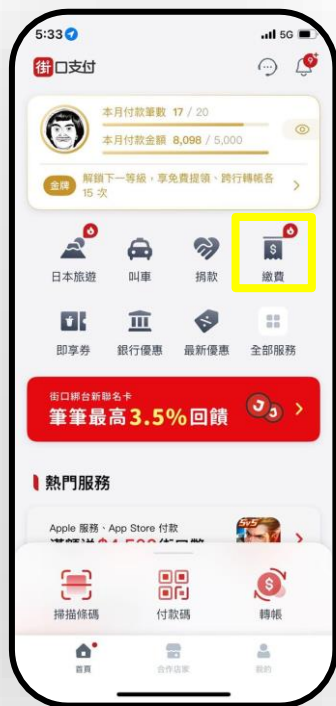
至街口首頁點選 「繳費」