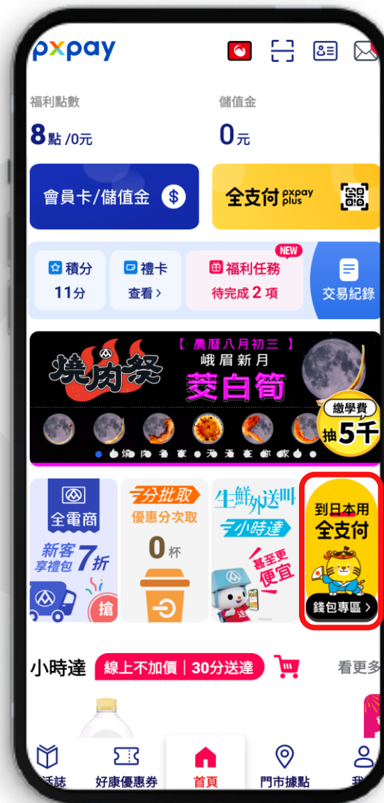
PXPAY 首頁點擊 [全支付錢包專區]